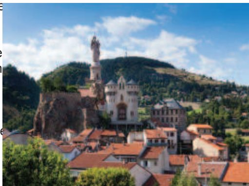
Saint Joseph d'Espaly

Le Puy a également accueilli nombre de papes et de rois venus en pèlerinage quêter pour eux et pour leurs peuples les faveurs de Marie. Urbain II commença au Puy la prédication de la Croisade pendant que l'évêque d'alors, Adhémar de Monteil composait à cette occasion le SALVE REGINA avant de partir en Terre Sainte à la tête des Croisés !