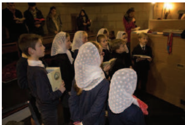
Les petits chanteurs de l'école le 8 décembre

- Le 10 décembre, Monsieur l'abbé Mérel nous présente l'histoire de Notre-Dame du Puy-en-Velay à l'aide de diapositives, afin de préparer les enfants au grand pèlerinage-jubilé du mois d'avril. Les élèves sont très intéressés et admiratifs devant la beauté des lieux (basilique et paysage).